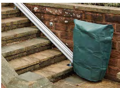
funda protectora incluida