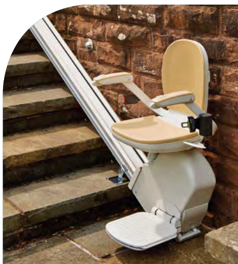
instalación a la intemperie