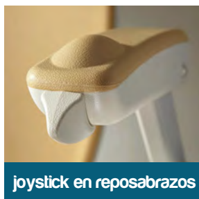
joystick en reposabrazos