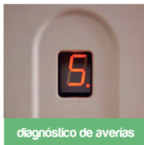
diagnóstico de averías